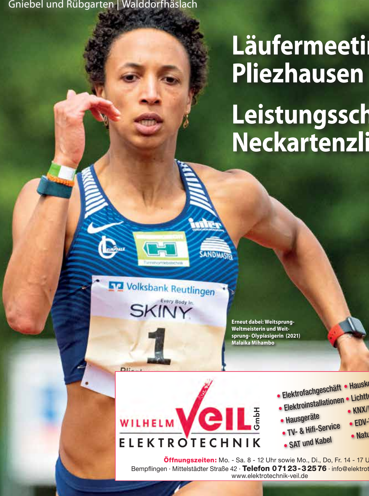
Erneut dabei: Weitsprung- Weltmeisterin und Weit- sprung-Olympiasiegerin (2021) Malaika Mihambo