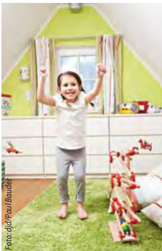
Freiraum zum Spielen schaffen: Als uriges Kinderzimmer sind die Räume unterm Dach gut geeignet.