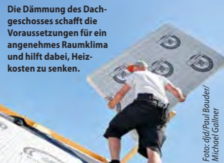
Die Dämmung des Dachgeschosses schafft die Voraussetzungen für ein angenehmes Raumklima und hilft dabei, Heizkosten zu senken.

Energie sparen und Raumklima verbessern Neben dem Spareffekt und dem Nutzen für den Klimaschutz steigert eine