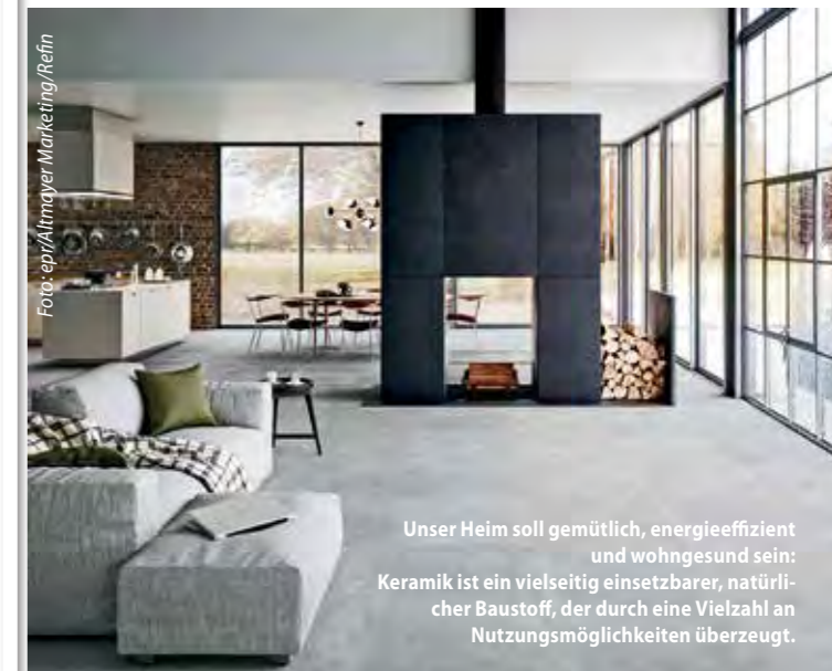
Unser Heim soll gemütlich, energieeffizient und wohngesund sein: Keramik ist ein vielseitig einsetzbarer, natürlicher Baustoff, der durch eine Vielzahl an Nutzungsmöglichkeiten überzeugt.

(epr) Für ein individuell gestaltetes, wohngesundes und energieeffizientes Zuhause steht uns ein seit Jahrtausenden bewährter Baustoff zur Verfügung: Keramik. Ob als Kleinmosaik oder als Fliese im XXL-Format, das Naturprodukt ist in vielerlei Farben, Dekoren und Oberflächen erhältlich. Unterschiedliche Möglichkeiten des Verlegens eröffnen weitere kreative Perspektiven, denn die charakteristischen Fugen erfüllen sowohl technische als auch gestalterische Aufgaben. Im Bad geben sie