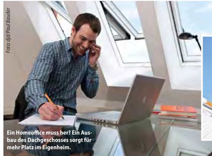
Ein Homeoffice muss her? Ein Ausbau des Dachgeschosses sorgt für mehr Platz im Eigenheim.

(djd). Wohnraum kann man nie genug haben. Schließlich ändern sich Anforderungen und Lebensumstände mit der Zeit. Wenn zum Beispiel aus dem provisorischen Homeoffice ein dauerhafter, vollausgestatteter Arbeitsplatz werden soll oder wenn sich Nachwuchs ankündigt, stößt so manches Eigenheim an die räumlichen Grenzen. Dabei schlummert unter zahlreichen Dächern eine unerkannte und bislang ungenutzte Reserve. Vielfach können